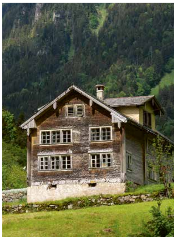
Noch ein «Heimä»: das Wissigli.

INFORMATIONEN Isenthal Tourismus, im Hotel Urirotstock, Telefon 079 510 49 58, www.isenthal.ch