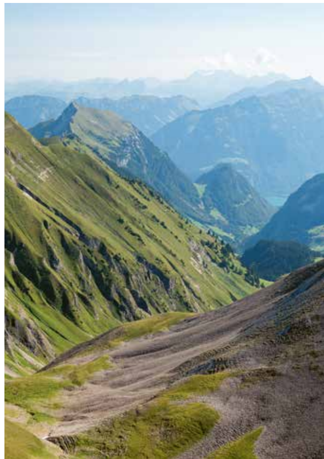
Links: Wildheuplanggen oberhalb Gitschenen.

ANREISE Noch beginnt die Postautofahrt ins Isenthal mal in Flüelen, mal in Altdorf. Ende 2021 wird allerdings der neue Kantonsbahnhof in Altdorf in Betrieb gehen, das Busnetz dürfte sich dann neu ausrichten. Die Linie ins Isenthal fährt bis St. Jakob, wo sich die Talstation der Seilbahn nach Gitschenen befindet. Das Chlital wird hingegen nicht bedient.