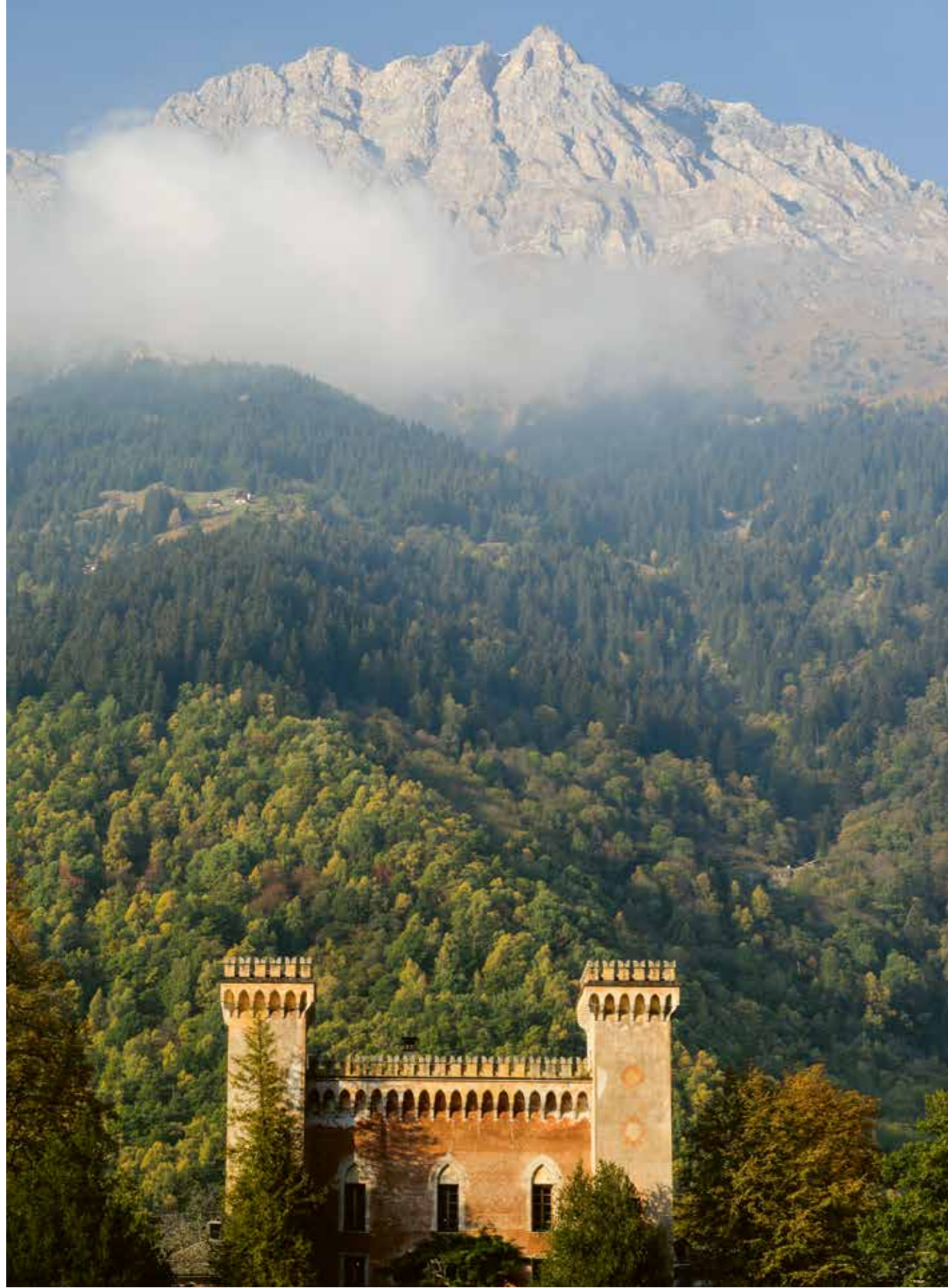
Am Fuss des Piz Duan thront der Palazzo Castelmur, gemäss Kunstführer ein «einzigartiges Baudenkmal der Bündner Rückwanderer-Architektur von landschaftsprägender Bedeutung».