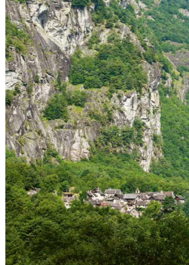
Sonlerto, eine der zwölf Terre des Val Bavona.