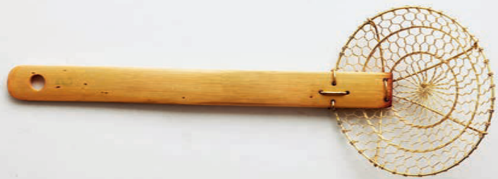
Frittiersieb (aus Stahldraht)