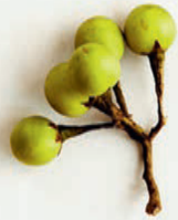
Erbseaubergine (Makeur Puang)