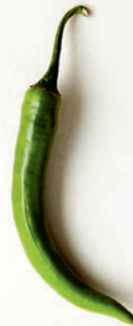
Große grüne Chili