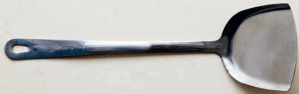
Wokschaufel mit langem Stiel