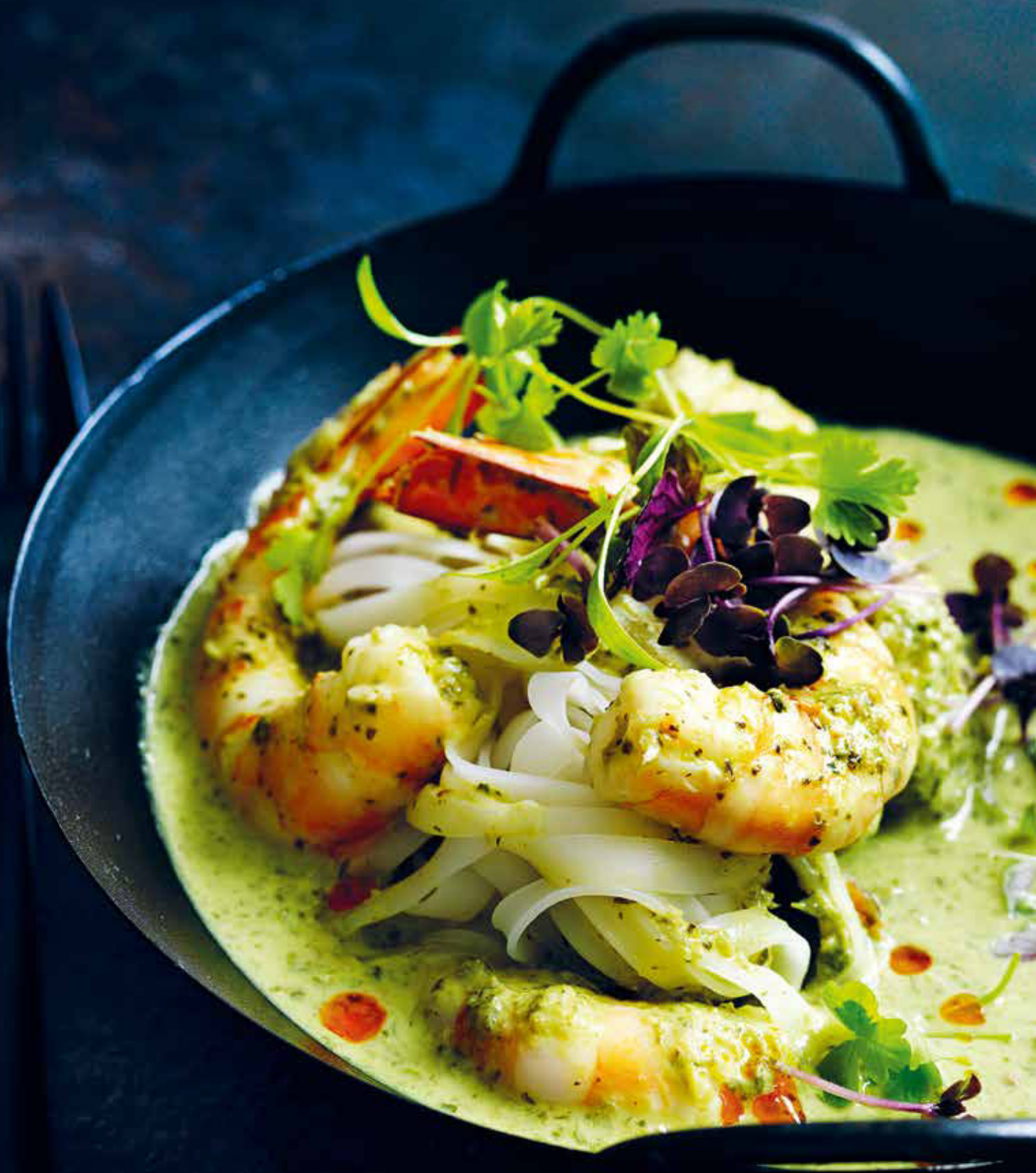
grünes garnelen-curry mit nudeln